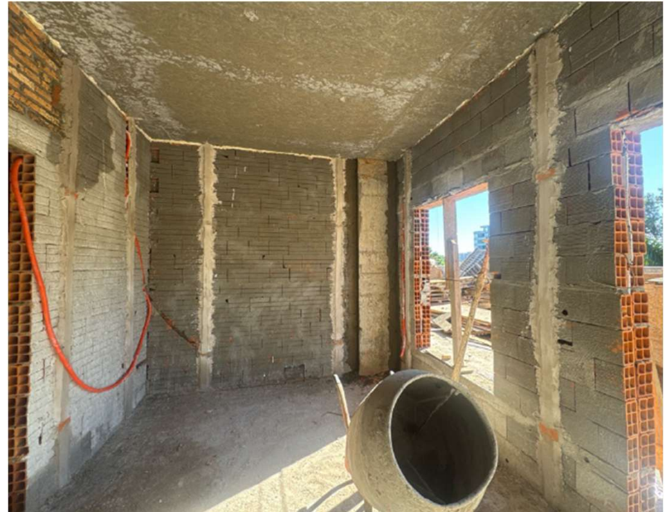
Avance de albañilería e instalaciones eléctricas en TH1