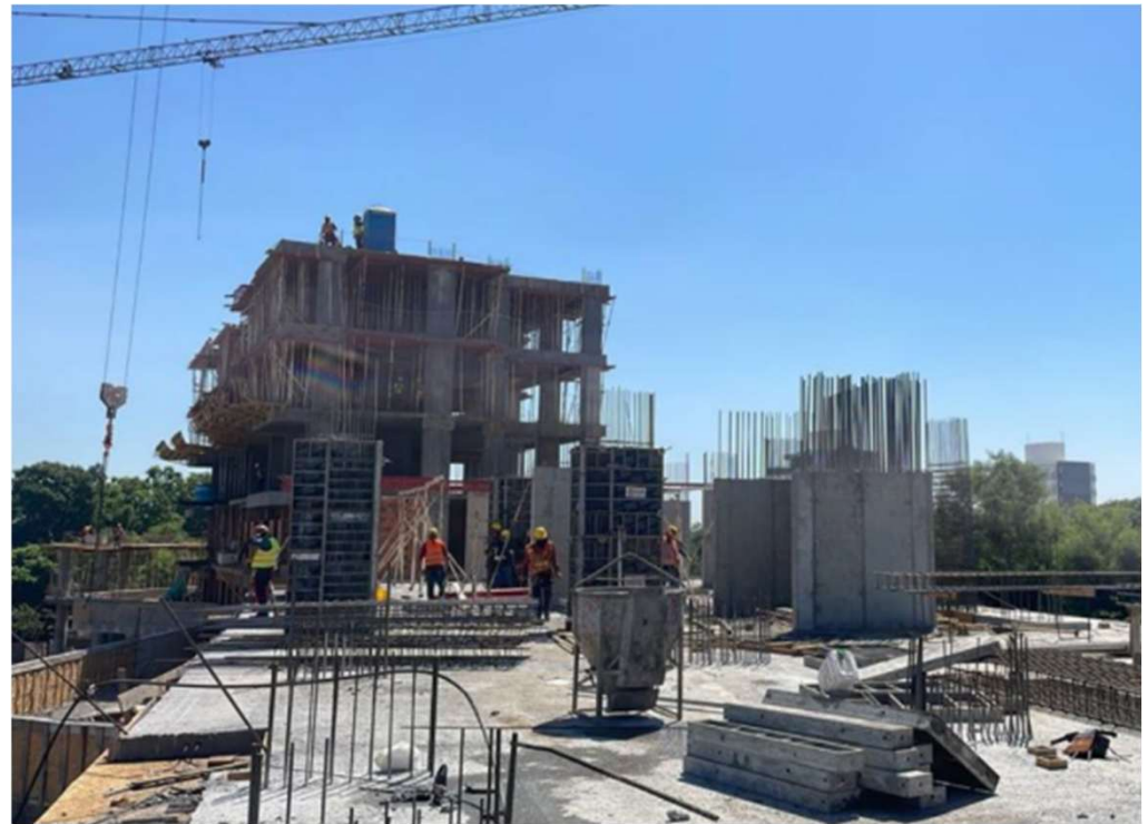
Losa N2 Torre Corporativa – Cargamento de Pilares de N2-N3 de TH2