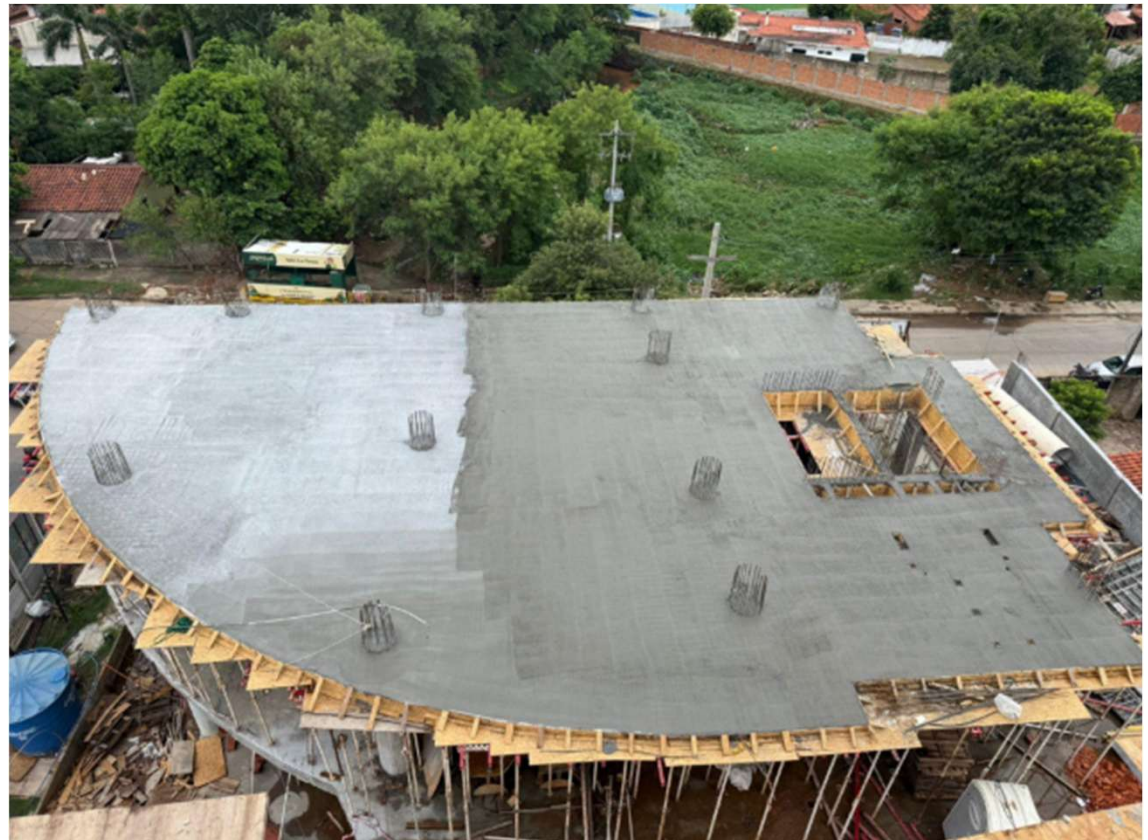
Cargamento de losa N3 de TH2 – Cargamento de losa N2 de Torre Corporativa